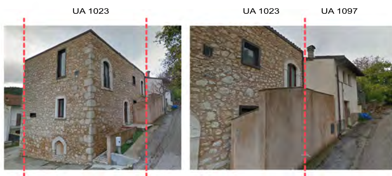
Via delle Carceri