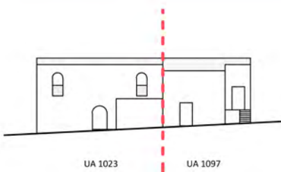
Via delle Carceri